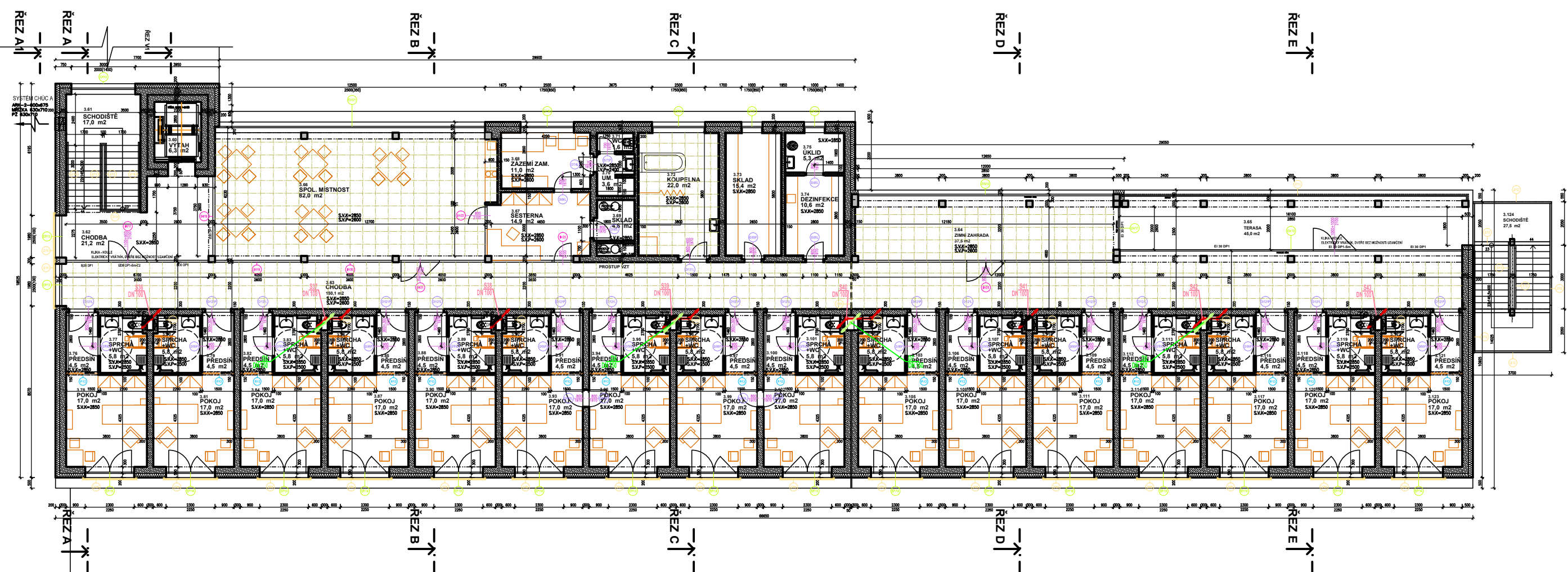
DĚLÍCÍ ROVINA VÝŘEZU DANÉHO PŮDORYSU